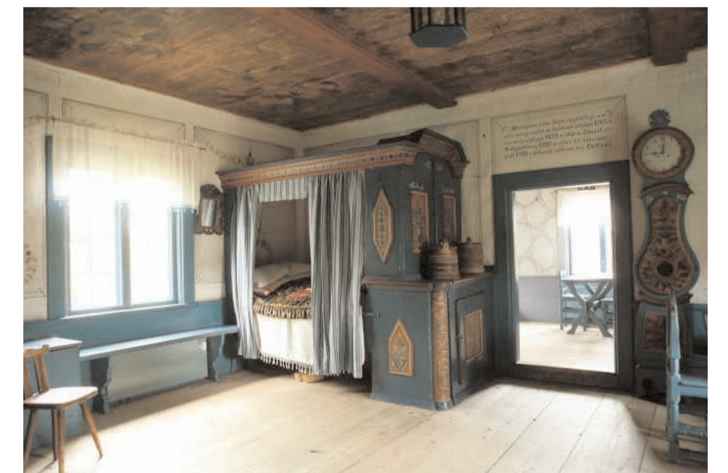
En rik samling allmogeföremål finns vid gården.